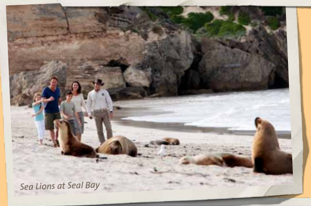
Sea Lions at Seal Bay