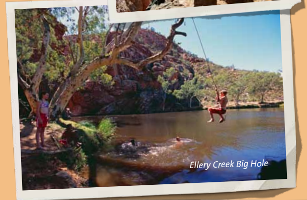
Ellery Creek Big Hole